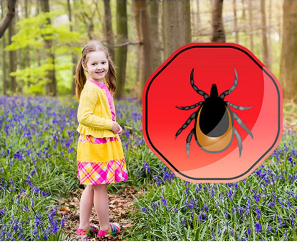
Zecken im Anmarsch